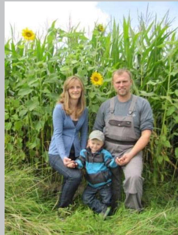
Hammingeln | Hünxe | Raesfeld | Rees | Schermbeck | Wesel