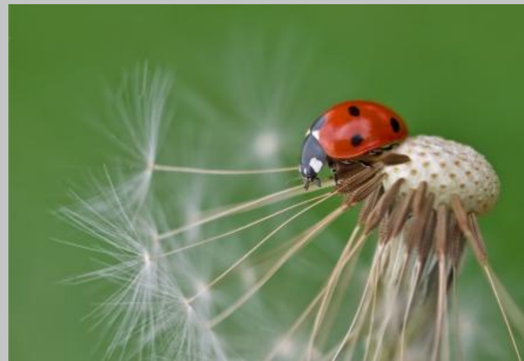
Hamminkeln | Hünxe | Raesfeld | Rees | Schermbeck | Wesel