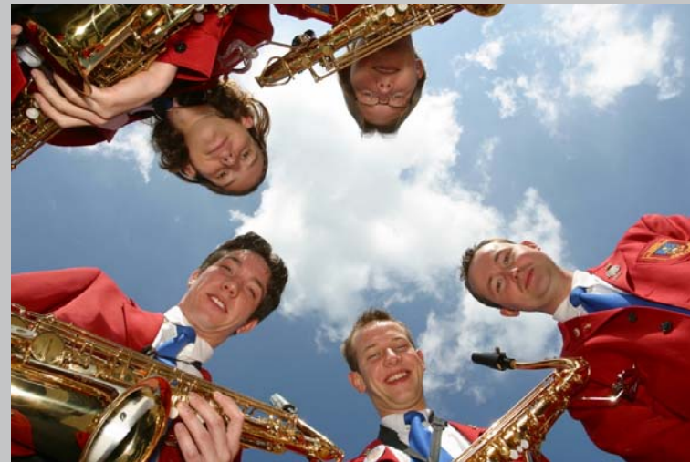
Hamminkeln | Hünxe | Raesfeld | Rees | Schermbeck | Wesel