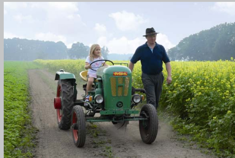
Hamminkeln | Hünxe | Raesfeld | Rees | Schermbeck | Wesel