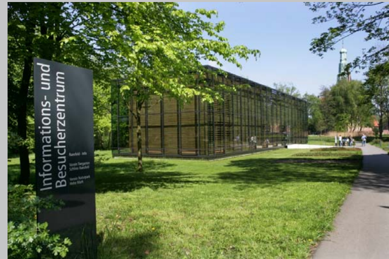
Hamminkeln | Hünxe | Raesfeld | Rees | Schermbeck | Wesel