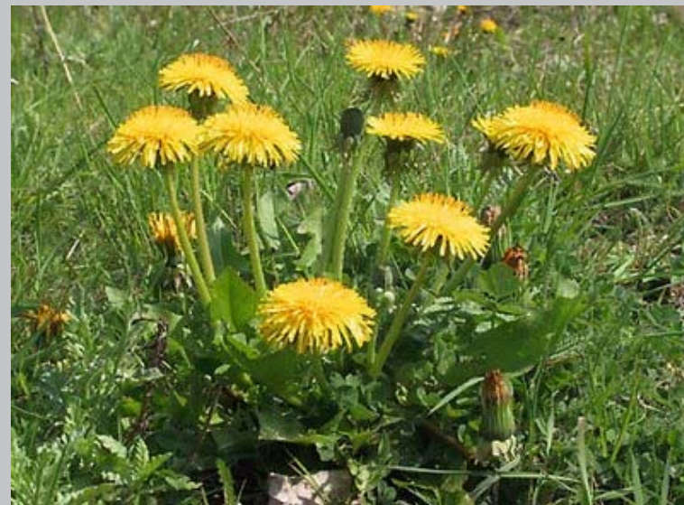
Hamminkeln | Hünxe | Raesfeld | Rees | Schermbeck | Wesel