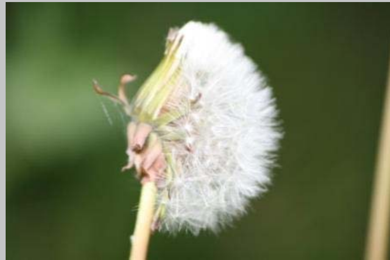
Hamminkeln | Hünxe | Raesfeld | Rees | Schermbeck | Wesel